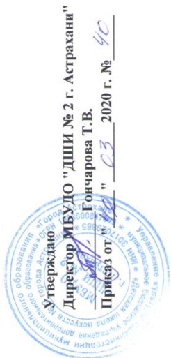
График образовательного процесса МБУДО "ДШИ № 2 г. Астрахани" на 2019-2020 учебный год